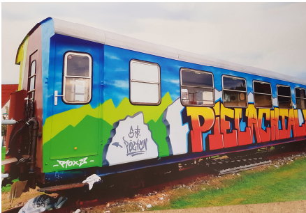
Ausstellungswagen Streetwork Pielachtal

Streetwork St. Pölten, Böheimkirchen und Eichgraben wird vorgestellt von Julia Zauchinger. Zielgruppe 12 – 23 Jahre, Unterstützung im öffentlichen Raum, teilweise durch Projekte.