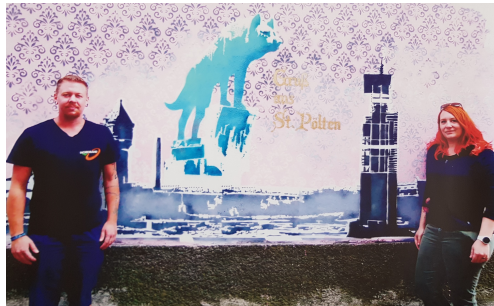
North Side Gallery St. Pölten